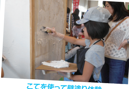
こてを使って壁塗り体験