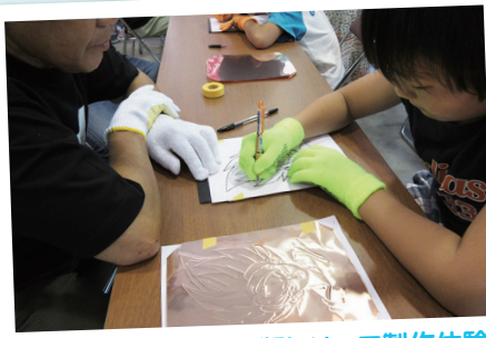
好きな絵を選んで銅版レリーフ製作体験