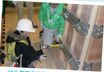
ビルを支える型枠の取り付け体験

◎駐車場は有料です。満車になることが多いため、なるべく公共交通機関をご利用ください。