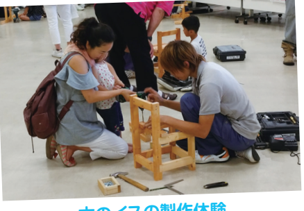
木のイスの製作体験