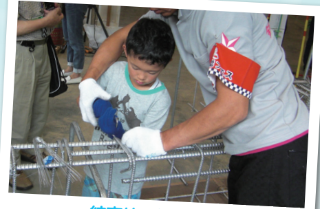
結束線の結び体験